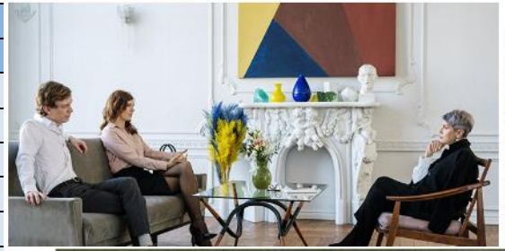
访谈演讲现场制作